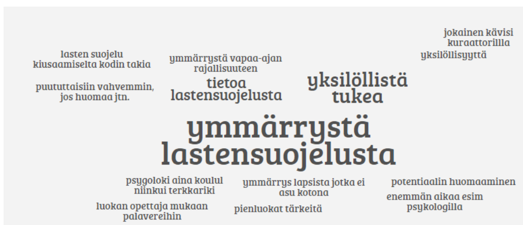
Kuva 2: Kokemusasiiantuntijoiden vastaus kysymykseen: Millaista apua ja tukea koulussa pitäisi olla?

Keskeisiksi ratkaisuehdotuksiksi kokemusasiiantuntijat ehdottivat muun muassa: 1) yhden asiakasta lähellä olevan ammattilaisen nimeämistä päävastuuseen palvelukokonaisuudesta, 2) asiakasperheen saattamista ja hallitumpaa siirtämistä palveluista toiseen, 3) asiakasnuoren oman sekä koko perheen näkemyksen kuulu-